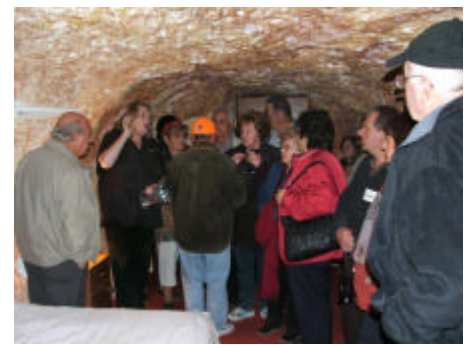
In una casa sotterranea di Coober Pedy