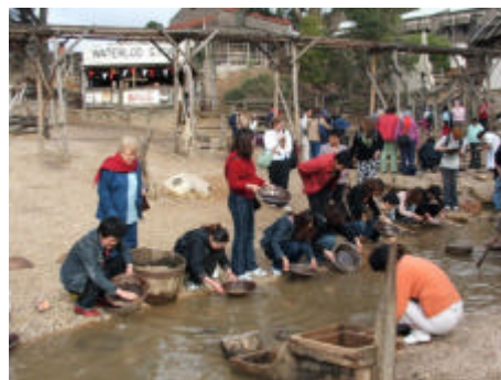
Turisti che scodellano il terriccio in cerca d'oro a Sovereign Hill

Fra i tanti posti visitati si ricorderanno a lungo il suggestivo villaggio minerario di Sovereign Hill, il territorio opalifero dall'aspetto lunare di Coober Pedy, il monolite