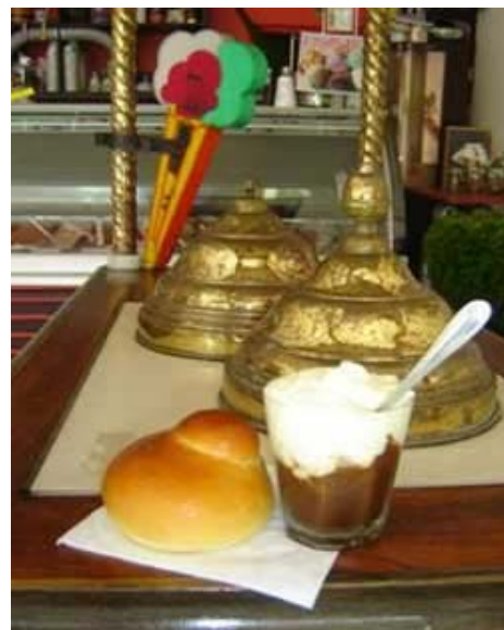
La Cremeria De Luca