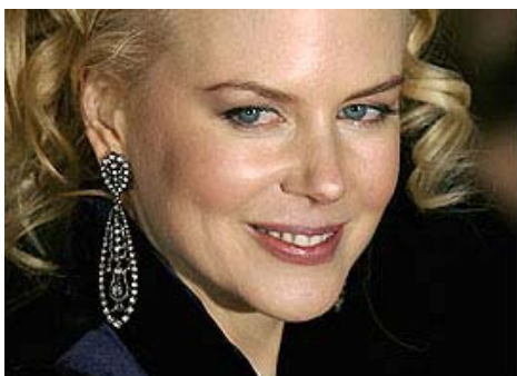
La bella attrice australiana ingravidata dalle sacre acque del fiume Kununurra

Affermazioni quanto meno fantasiose, incredibili anche perché la Kidman non ha spiegato in che modo le acque di quel fiume abbiano potuto influire (o addirittura determinare?) sulla gravidanza sua e di altre sei colleghe di set rimaste incinte nella stessa occasione.