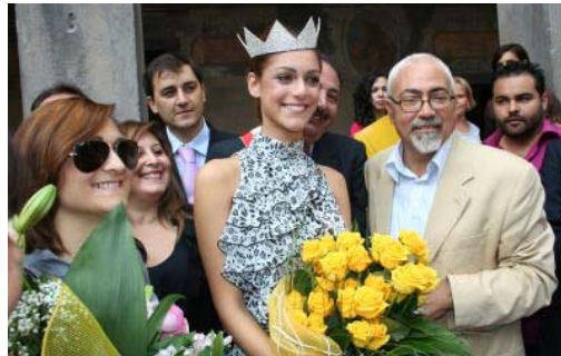
La felice vincitrice con i suoi genitori ed amici

Vive ad Acireale con la sua famiglia e il suo amato gatto. Le mancano due esami per laurearsi nella facoltà di lettere di Catania